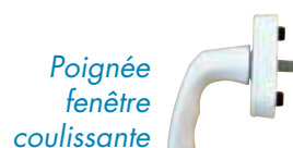
Poignée fenêtre coulissante